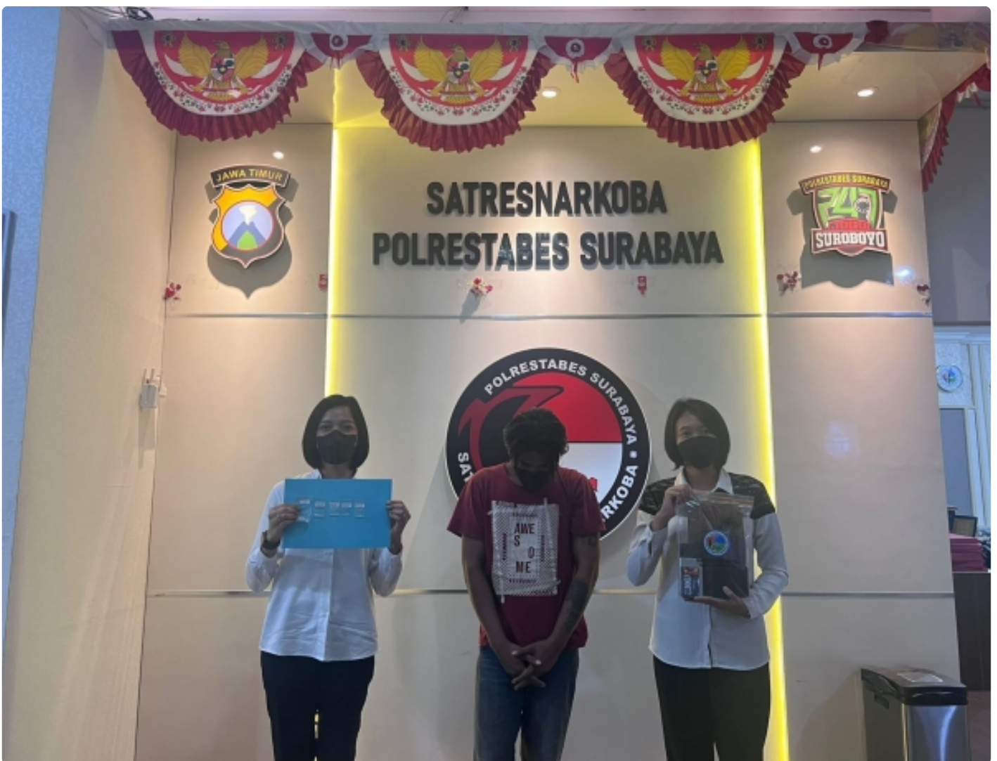
SURABAYA - Polisi mengamankan seorang kuli batu berinisial AMM di Simo